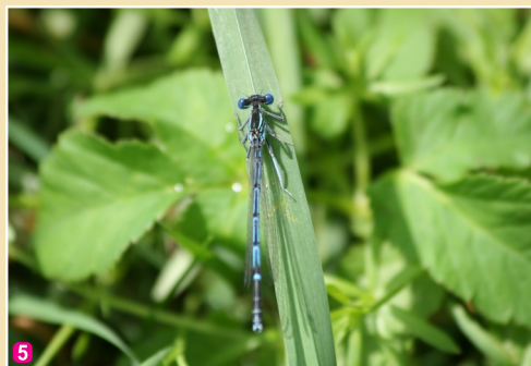
5 Zilā platkājspāre