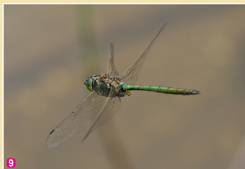
9 Agrā smaragdspāre