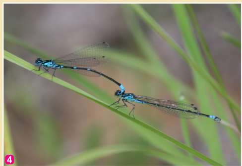
4 Tumšzilā krāšņspāre