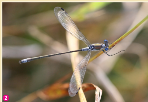
2 Rudens zaigspāre