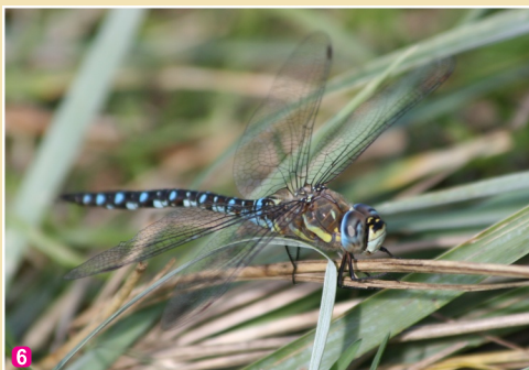
6 Dienvidu dižspāre