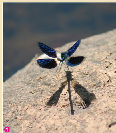
1 Upju zilspāre

7 Ārpus dabas parka noteikti vērts doties uz Sventes vai Medumu ezeru , noteikti interesants ir Boltmuižas purvs , kur iespēja sastapt vēl pa kādai retākai spāru sugai.