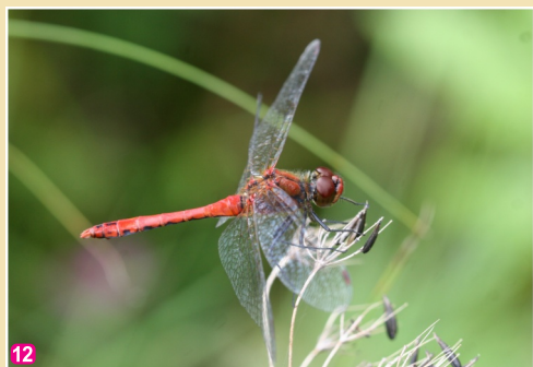
12 Sarkanā klajumspāre