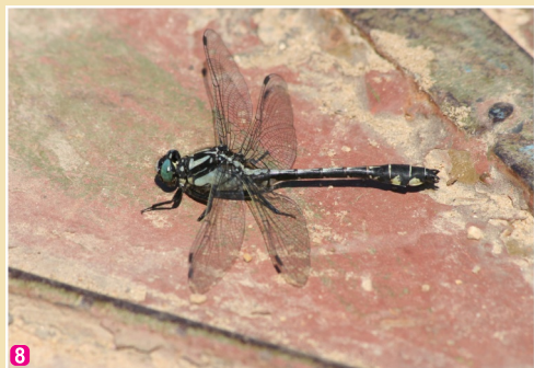
8 Melnkāju upjuspāre