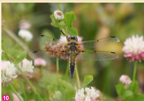
10 Plankumainā spāre