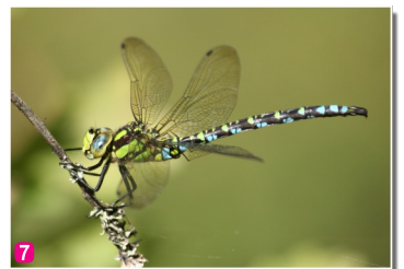
Viena no lielākajām Latvijas spārēm – zilzājas džīspāres tēviņš – sasniedz pat 7,5 cm garumu

Citus aktīvā tūrisma maršrūtus meklējiet www.celotajs.lv !