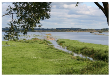
Dviete palienē vasaras beigās – spāres vislabāk novērot tieši ūdens tuvumā

Ieteicamais noteicējs spāru atpazīšanai iegādājams tīmekļa veikalos: Dijkstra & Lewington, R. (2006). Field Guide to the Dragonflies of Britain and Europe .