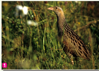
1 Grieze Crex crex

Galvenā šīs vietas vērtība ir pļavas un ūdens, kāpēc arī nav brīnums, ka ziemā šo vietu pārņem cieņas pilns stingums. Aizsaluša Skuķu ezera krastos klauzina kād baltmugurdzenis, Dvietes parkā skajāk uzvedas vidējais dzenis, starp sniegiem un šķūņiem klaiņo laukirbju bariņi. Taču gan ziemā, gan citkārt apskates vērtas ir savvaļas zirgu un Augšzemes (Highlander) govju ganības Bebreņu pusē. Bebreņē meklējama Akmeņupītes dabas taka, kur neliels stends veltīts parastākajām putnu sugām, kas tur sastopamas – piemēram, parastais ķeģis.