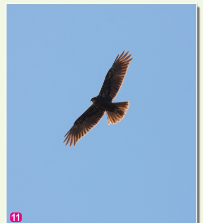
11 Niedru lija Circus aeruginosus

Apzīmējumi: ■■■■ - suga novērojama regulāri, ■■■■■ - suga novērojama neregulāri, * - dzirdamas šo sugu balsis