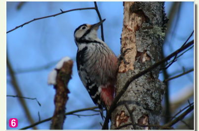
6 Baltmugurdzenis Dendrocopos leucotos