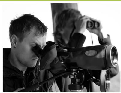
Putnu vērotāji Dvietes tornī diennakts putnu vērošanas sacīkstēs

Dviete kā vieta ir interesanta gan ļoti pieredzējušiem putnu vērotājiem, jo šī ir reālākā vieta Latvijā, kur mēģināt atkārtoti novērot kaimiņos Baltkrievijā ligzdojošo pundurērgli un potenciāla vieta grīšļu kauka ligzdošanai. Taču tā būs interesanta arī ikvienam putnu vērošanas iesācējam, jo īpaši pavasarī, kad zosu skaits plašajās palienēs ir līdzvērtīgs Dziesmu svētku Lielkoncerta atmosfērai.