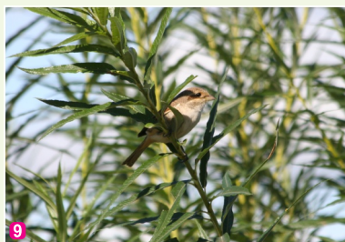
9 Brūnā čakste Lanius collurio