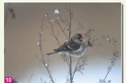
10 Parastais ķeģis Carduelis flammea flammea