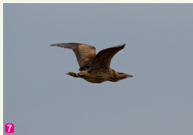
7 Lielais dumpis Botaurus stellaris