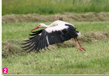
2 Baltais stārķis Ciconia ciconia