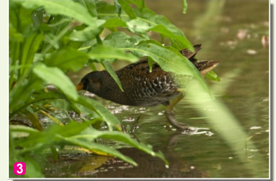
3 Ormanītis Porzana parva