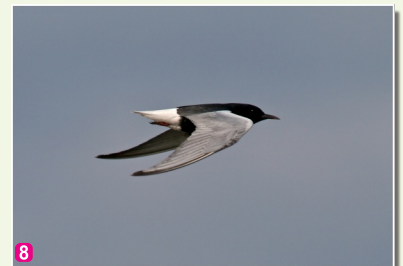
8 Baltspārnu zīriņš Chlidonias leucopterus