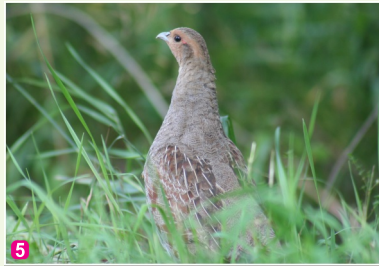
5 Laukirbe Perdix perdix