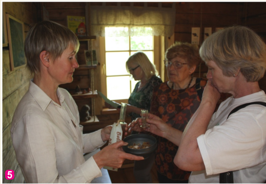
Bebra dziedzeru uzlējuma degustācija