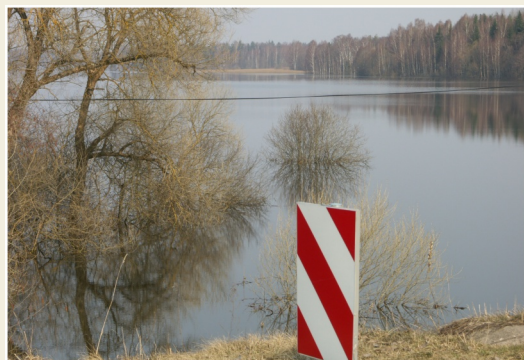
Dviete pie Dvietes ciema