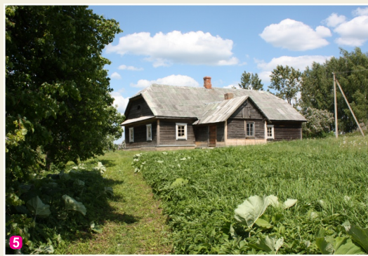
Dvietes senlejas informācijas centrs "Gulbji"