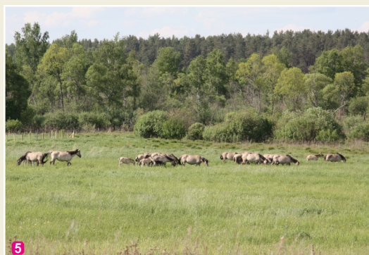
Putnu salas aploks